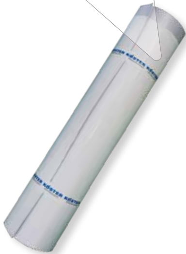
KÖSTER TPO SK (FR) Dachbahn